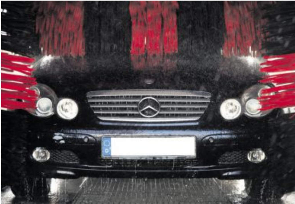
In der Regel geht alles gut, was aber tun, wenn das Auto bei der Fahrt durch die Waschstraße doch einmal Schaden nimmt?

Mitfahrer oder andere Autofahrer können als Zeugen dienen. Beschädigungen sollten Betroffene sofort den Mitarbeitern der Anlage mitteilen. „Die Schadensmeldung und die bemängelten Schäden sind dabei schriftlich zu dokumentieren“, erklärt Mielchen. Sie rät außerdem dazu, die einzelnen Schäden