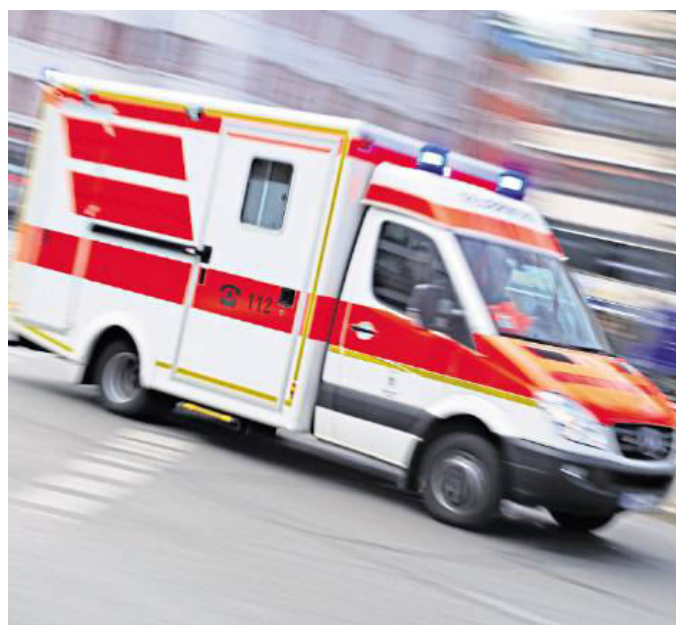
Auch Rettungswagenfahrer, die mit Blaulicht und Martinshorn unterwegs sind, haben gewisse Spielregeln im Straßenverkehr zu beachten.

Das Gericht gab der Versicherung recht. Der Fahrer des Rettungswagens muss zu einem Drittel mithafteten. Dieser habe zwar das sogenannte Wegerecht, wonach ihm andere Verkehrsteilnehmer sofort Platz machen müssen. Aber nur wenn er eine „berechtigte Erwartung“ hat, dass die anderen sich korrekt verhalten, dürfe er auf das Freimachen der Bahn vertrauen. Da aber der Linksabbieger den Blinker nicht abgestellt hatte und auch nicht aktiv nach rechts gefahren war, handelte es sich hier um eine unübersichtliche Lage. Außerdem war der Rettungswagen mit 82 km/h klar zu schnell gefahren.